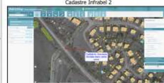
Cadastre Infrabel 2