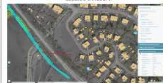
Cadastre Infrabel 1