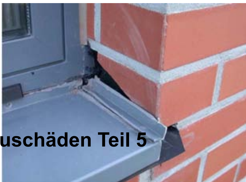
Bauschäden Teil 5