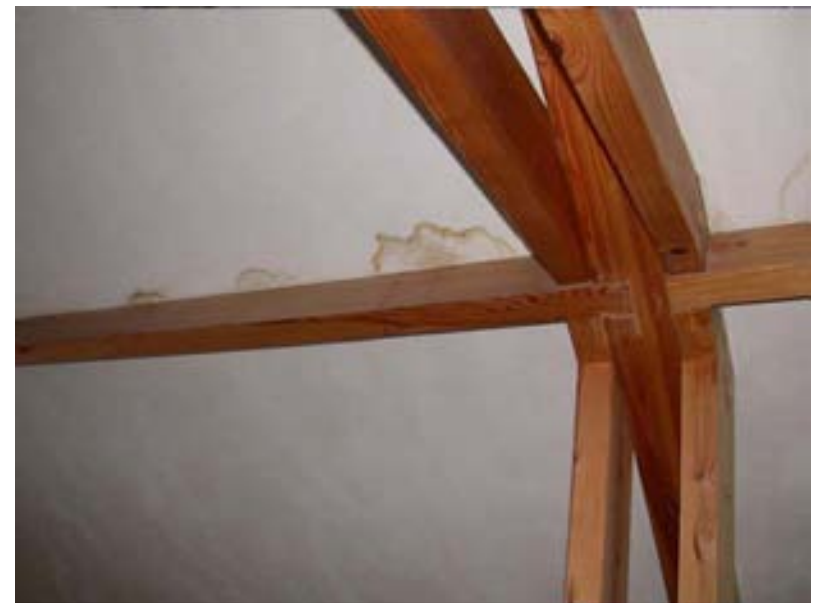
Bauschäden Teil 2